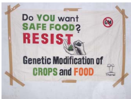
One of the banners

The Week of Rice Action (WORA-2008) was celebrated all over Asia between 2 nd April and 8 th April 2008 with a campaign call for “No Genetically Engineered Rice in Asia”. On 8 th April, many groups all over the world came together and participated in a "People's NO Genetic Engineering (GE) Day" in their respective countries and states to protest against the Genetic Modification of Crops and Food and asked Governments to be more responsible to the people - consumers and farmers.