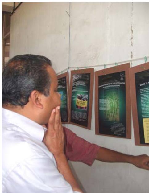
Minister reading the poster exhibition

As part of the campaign the following were prepared and used