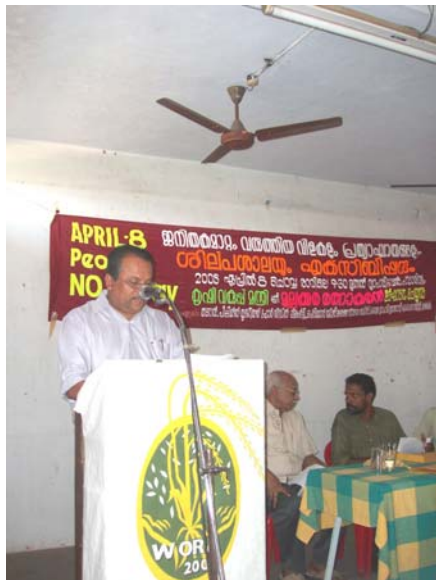
Minister inaugurating the workshop