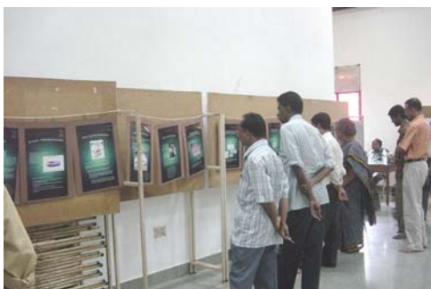
GM Poster exhibition displayed at World Earth Day April 22 nd 2008 organized by GREENS-Trivandrum

they can be continued to be used for the campaign against GE.