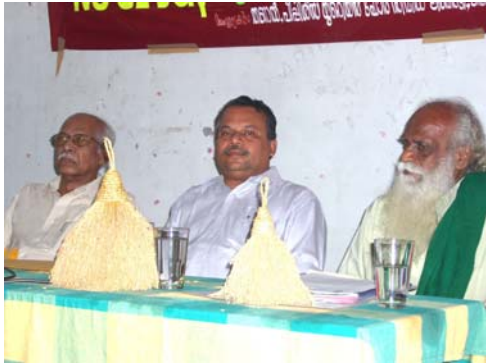
Traditional welcome with rice bouquets (kathir kula)