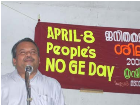
Kerala's Agriculture Minister Sri Mullakara Rathnakaran speaking